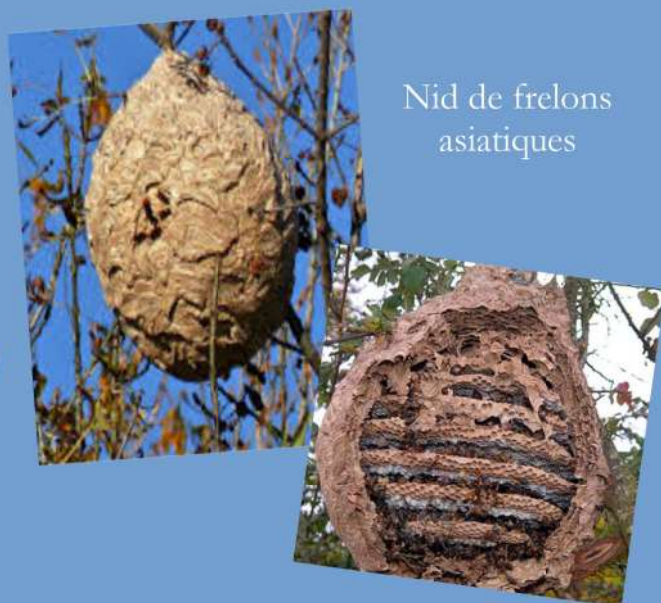
Nid de frelons asiatiques