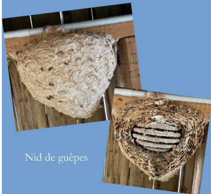
Nid de guêpes

Les référents sont des apiculteurs bénévoles, ils ne peuvent pas toujours répondre aux appels, n'hésitez pas à laisser un message pour qu'il vous rappelle et/ou un SMS avec les photos et la description des lieux si cela est possible.